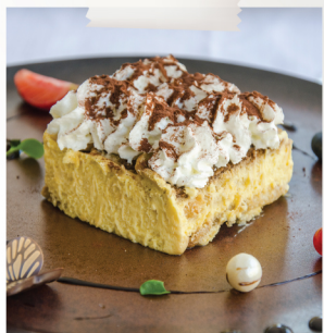
Tiramisù tradizionale 7 €